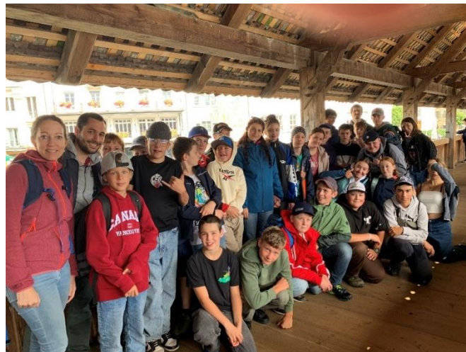
(OS Matt auf der Kapellbrücke)