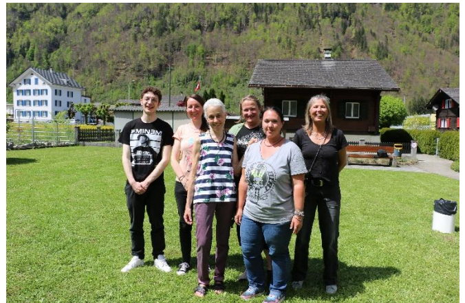
(Team Hort Linthal)

Wir wünschen allen Kindern viel Freude beim Bauen, Graben, Backen. Und denkt daran: Wer Sand in den Schuhen hat, trägt ein Stück Kindheit mit nach Hause.